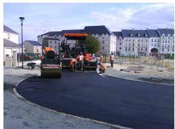
DPRU Ville de Blois-oct 2009

Aujourd'hui, il reste 47 145 heures de travail à réaliser grâce à la Clause d'Insertion avant la fin du PRU en 2013.